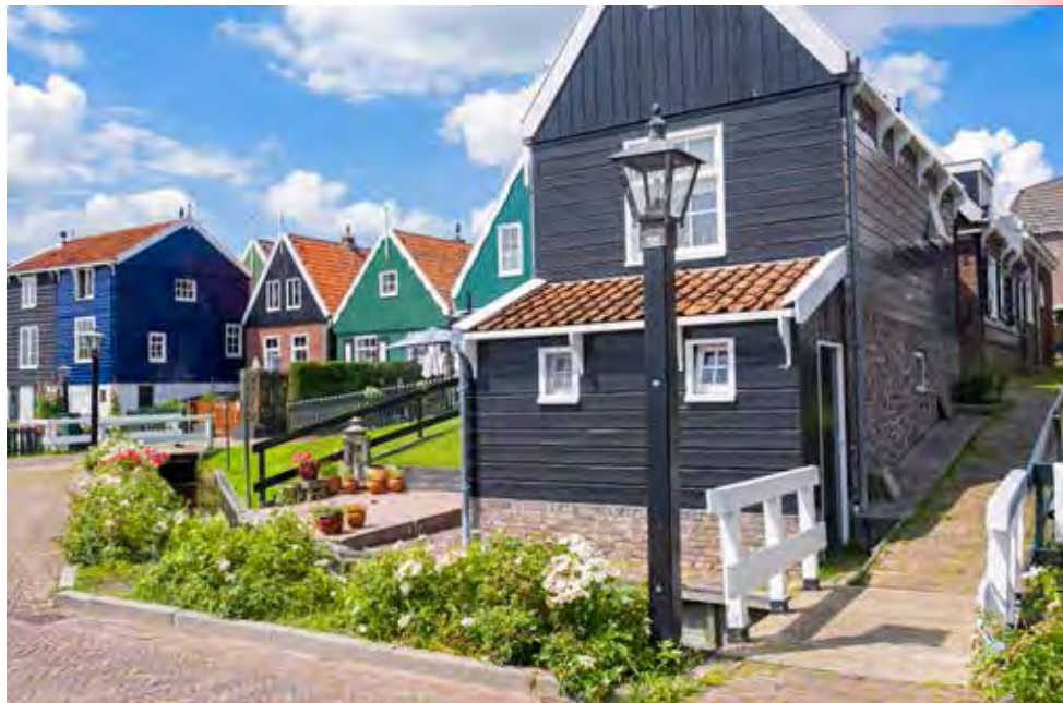
Het labyrint van houten geveltjes op Marken

punten op de route worden aangegeven met een wit nummer in een groen cirkeltje. In principe kun je de route fietsen met alleen deze topografische kaarten. Ter ondersteuning is het gemakkelijk om de knooppunten die je bij ieder traject vindt te volgen. Deze staan achterin het boek. De route valt grotendeels samen met knooppuntroutes. Je fietst daarbij van nummer naar nummer. Deze nummers worden op iedere kruising aangegeven met speciale bordjes. Soms is het even zoeken, maar meestal hangen ze ergens aan een paal. Het is een wit bordje met een groen nummer in een cirkel, een groene pijl die de richting aangeeft en een fiets. Wanneer je aan het einde van een route komt, staat er een groot bord met een overzichtskaart van alle knooppuntroutes