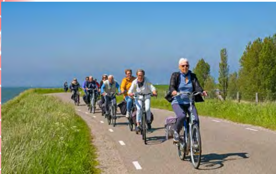
De dijk langs het Markermeer, van Hoorn naar Enkhuizen

watertoren, weet je dat het land ouder is. Vlak voor Anna Paulowna steken we het Hooge Oude Veer over. Anna Paulowna ligt in een groot bloembollengebied in de gelijknamige polder. Na de stad fiets je langs de Molenvaart en gaat het met een pontje het Noordhollandsch Kanaal over. Via Julianadorp gaat de route richting Den Helder. Op weg naar de haven passeer je de Rijkswerf Willemsoord, de oude werf van de Koninklijke Marine. Hier zijn nu veel restaurants. Tegenover het oude Fort Harssens vertrekt de veerboot naar Texel.