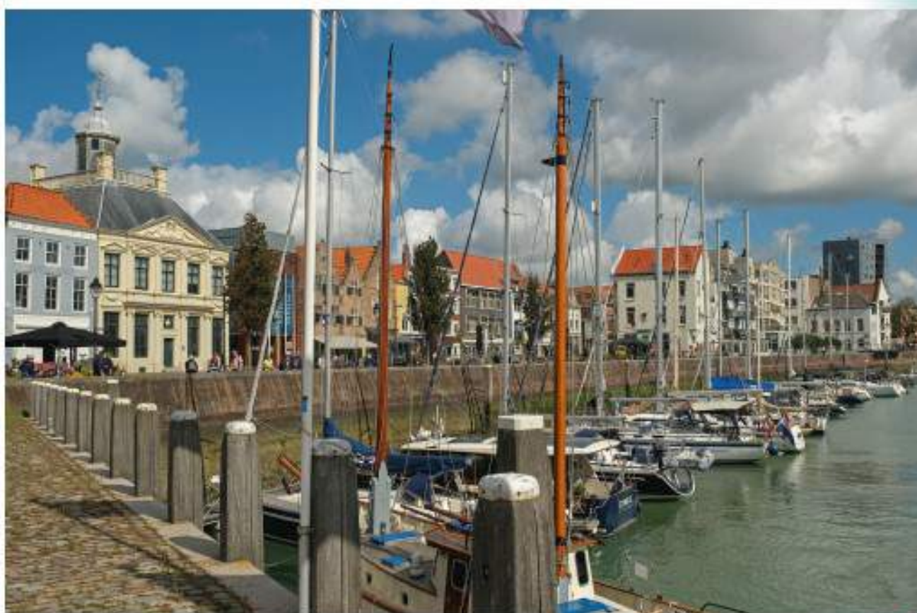
De haven van Vlissingen

Het eerste wat je ziet, wanneer je vanaf het station over de sluis en langs de Westerschelde richting het centrum fietst