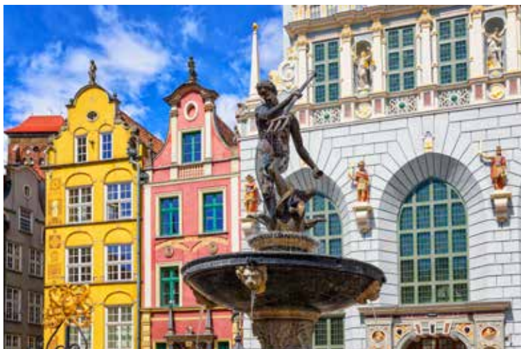
Kleurrijke herenhuizen en de Neptunusfontein in Gdańsk

ontelbare prominenten, waaronder Jan Heweliusz (studeerde in onder andere Leiden, astronoom, 1611-1687), Gabriel Fahrenheit (natuurkundige, stierf in Den Haag in 1736) en Donald Tusk (voorzitter van de Europese Raad van 2014 tot 2019).