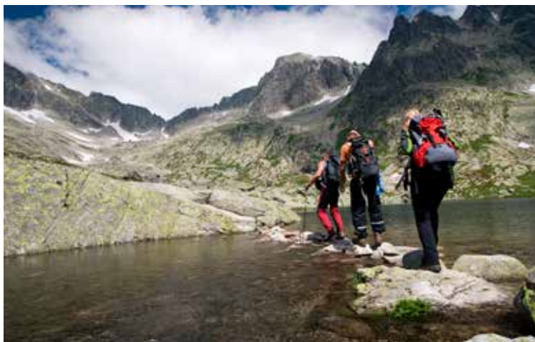
Bergwandelen in de Tatra