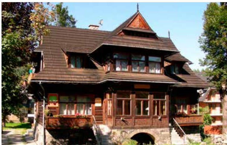
Guesthouse in Zakopane