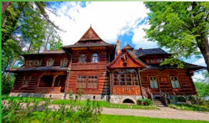
Villa Koliba, Zakopane